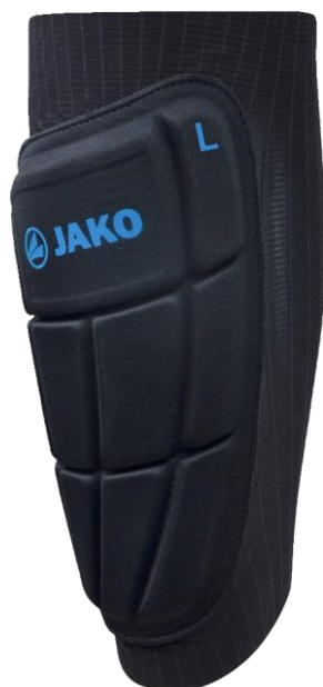
2739 - Щиток PRESTIGE KEVLAR COMBI

Такой продуманный продукт не может быть изготовлен где-либо. По этой причине PRESTIGE KEVLAR производится в Германии, в Баден-Вюртемберге. Три варианта щитков DUO, COMBI и SOLO доступны в спортивных магазинах и у дистрибуторов.