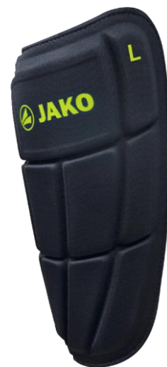
2741 - Щиток PRESTIGE KEVLAR SOLO