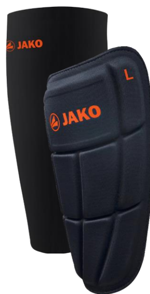
2740 - Щиток PRESTIGE KEVLAR DUO